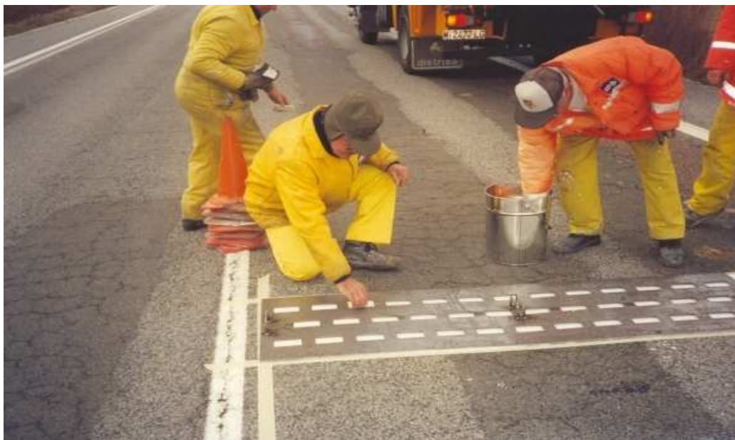
Colocación de los resaltes con la ayuda de una plantilla